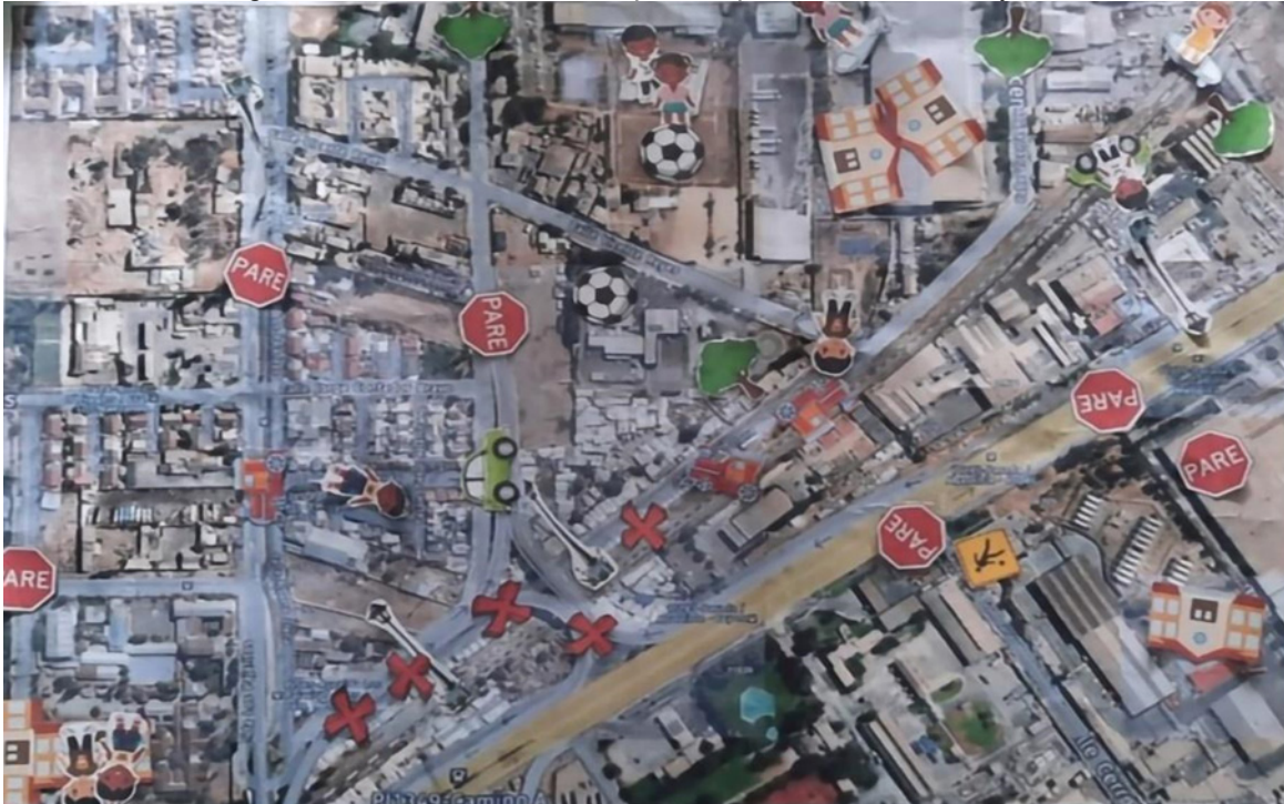
Figura 5: Primera sesión de mapas cooperativos con niños y niñas