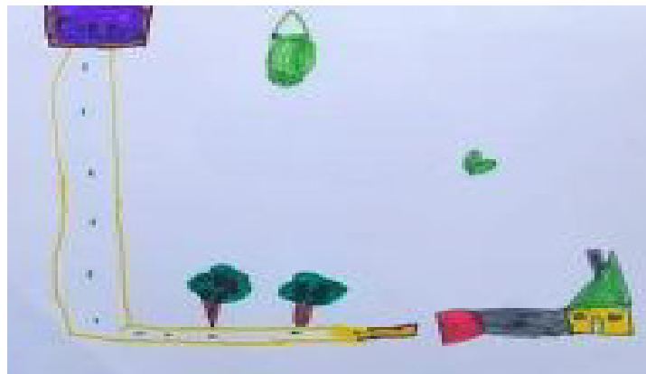
Figura 3: Mapa del trayecto del colegio al hogar realizado por niña de 7 años