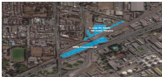
Figura 1: Mapa de Campamentos Vicente Reyes, Luna de Haití y Villa Ferrocarril

El campamento Vicente Reyes ubicado en la comuna de Maipú, es uno de los once asentamientos irregulares de la comuna 2 . Se estima que aproximadamente 300 familias viven en los campamentos Vicente Reyes y Luna de Haití a partir del año 2017 (Revista EI, 2021).