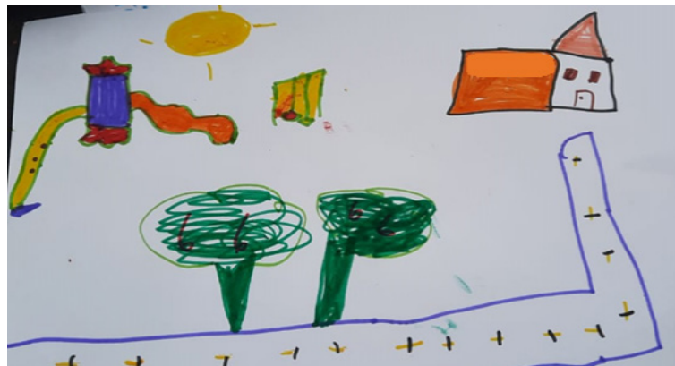
Figura 2: Mapa del trayecto del colegio al hogar realizado por niña de 8 años.