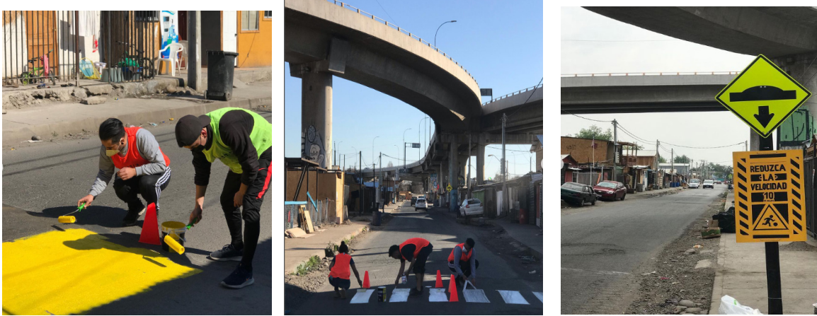
Figura 6, 7 y 8: Intervención de señalética por parte del Proyecto Amar Migrar