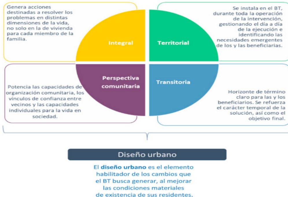
Figura 1. Ejes Modelo de Intervención Barrio Transitorio

El primer resultado de la investigación fue la formalización del MIBT compuesto por 5 ejes que resumen las características de su quehacer y explica el logro de los objetivos del modelo (Figura 1).