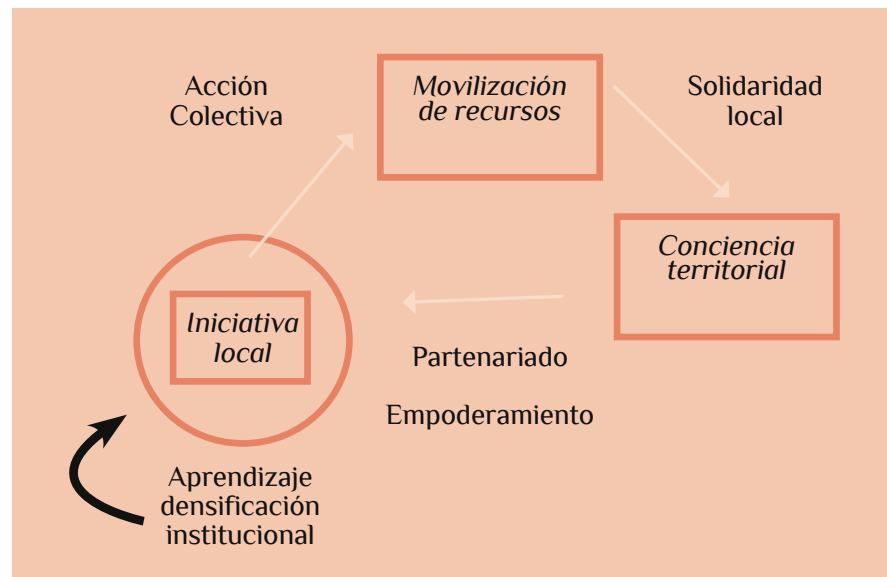
Etapas de la construcción de un medio socialmente innovador